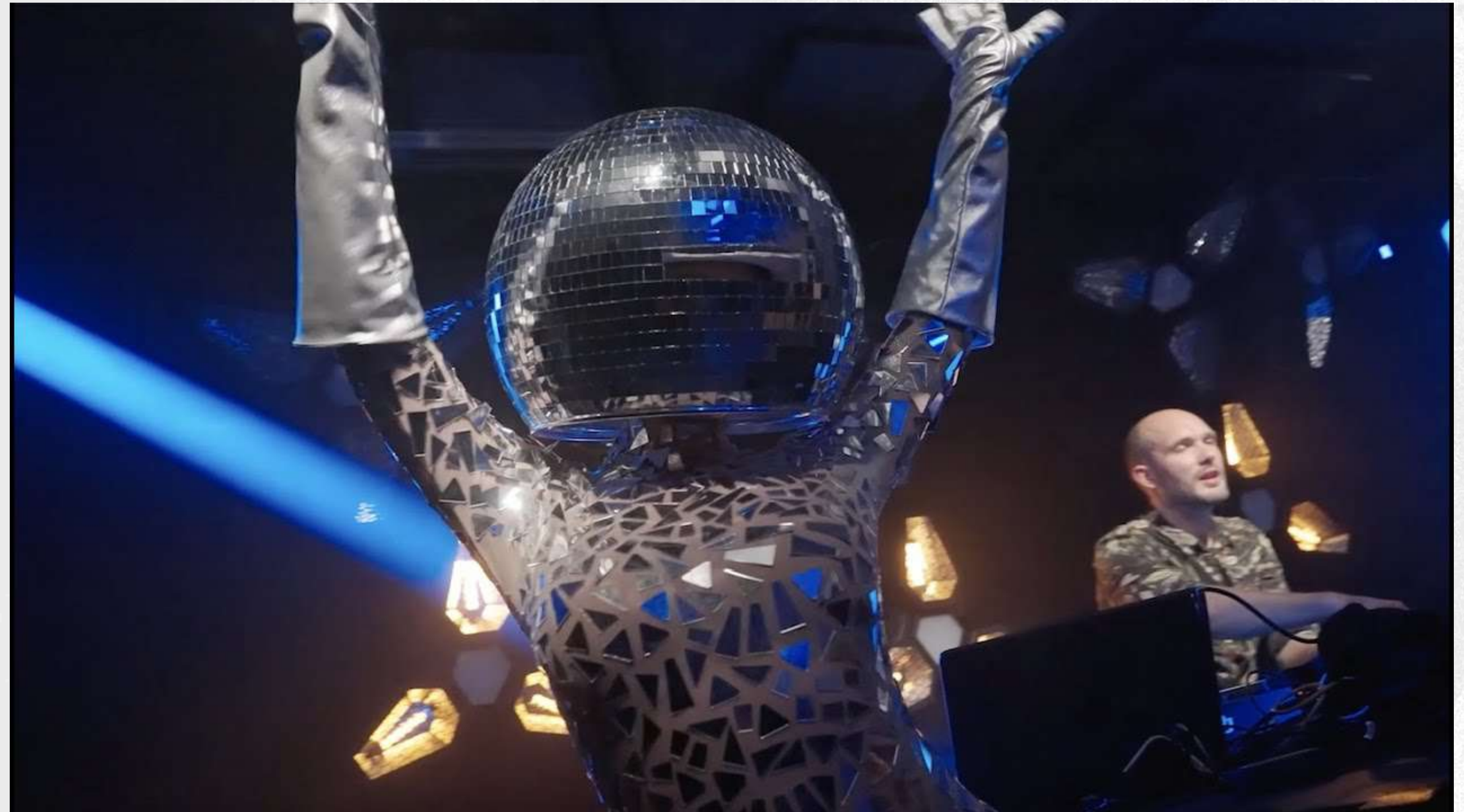
Dutch Standard Showreel - klik op de video om af te spelen.

Wij zijn Dutch Standard; jouw partner voor onvergetelijke evenementen. De beste manier om dit te delen is door middel van ons portfolio. We laten je graag wat van ons beste werk zien - leun achterover en geniet!